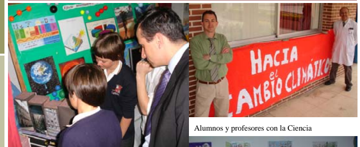
Alumnos y profesores con la Ciencia