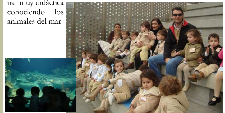
Los patos en el Oceanográfico

Nuestros patos visitaron el Oceanográfico y pasaron una mañana muy didáctica conociendo los animales del mar.