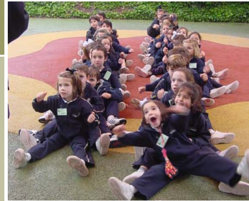
Las jirafas, ardillas y osos visitan el Parque Infantil de Tráfico